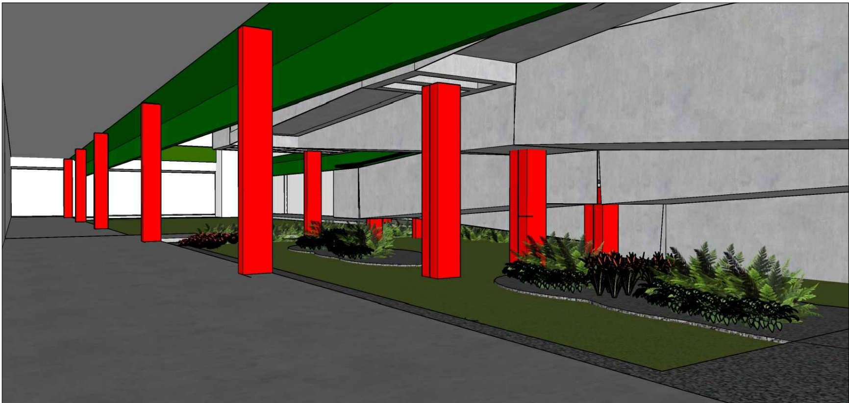
12 REPRESENTAÇÃO EM 3D - ESPAÇO SOB A RAMPA