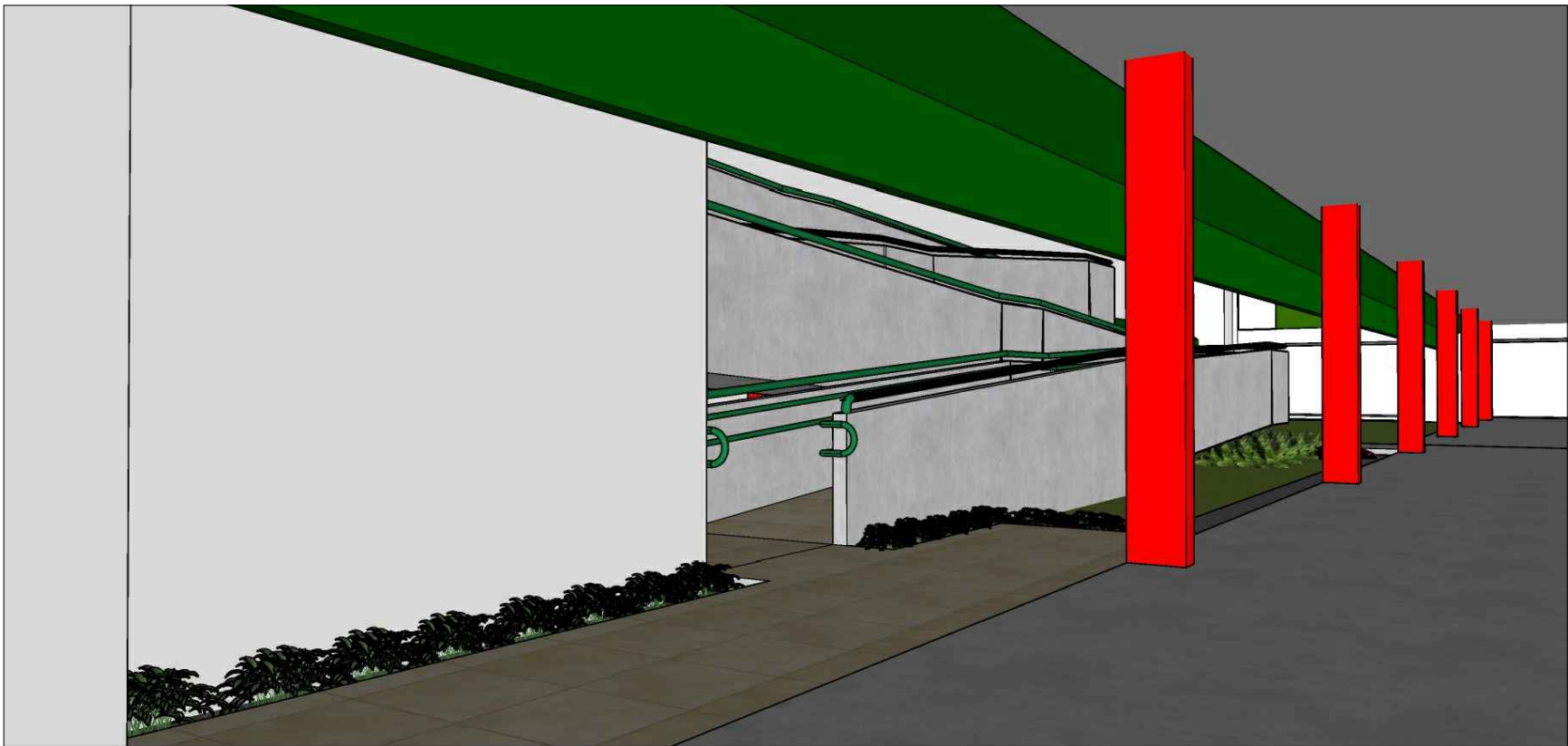
11 REPRESENTAÇÃO EM 3D - ACESSO TÉRREO